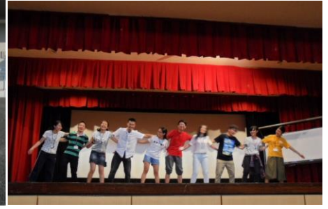
8月14日(金)～16日(日) 中国四国地区