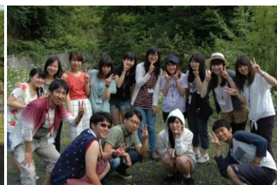
8月14日(金)～16日(日) 北海道地区