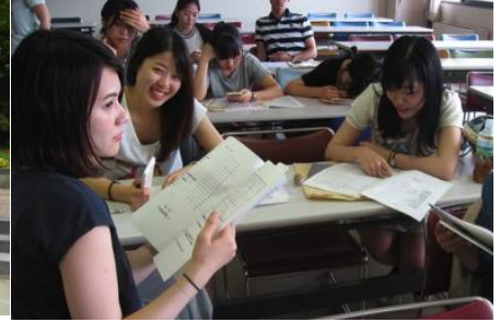
9月5日(金)～7日(日) 九州地区