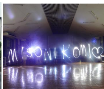
9月4日(金)～6日(日) 東海地区