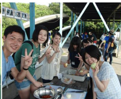
8月21日(金)～23日(日) 関東地区