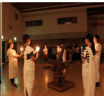
8月15日(土)～17日(月) 近畿地区