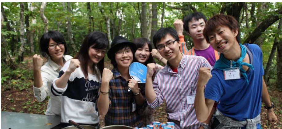
東海地区交流集会でのスナップ

ここでの出会いは一生忘れられない思い出になるので、ここで得た友情、勇気、希望を持って新しい人生、新しい世界に飛び込むように頑張っていきたいです。