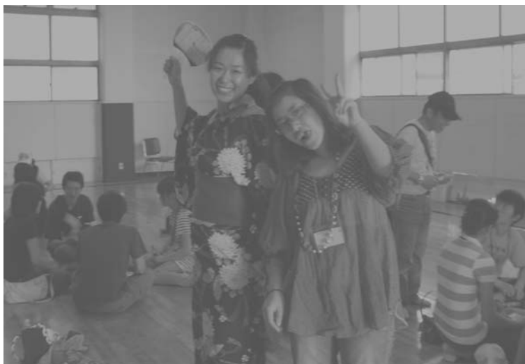
2009年度関東地区交流集会でのスナップ