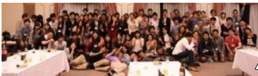
第三回開催の様子

この大同窓会で、「育英友の会」というキーワードを通して、つながった仲間と年に1度一堂に会し、自分達の交友の輪を広げ、連綿と続く強い絆を築いて頂けたらと考えております。