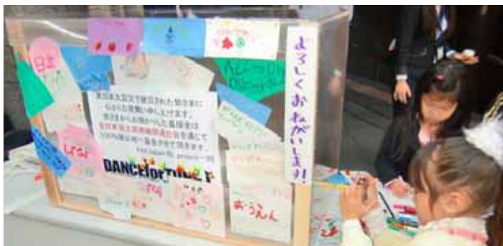
チャリティーイベントで寄せられる善意！

被災地支援を目的とする East Japan RE: project 主催のチャリティーイベントが、育英友の会近畿支部が後援して4月の10日に大阪難波の難波OCATで行われました。