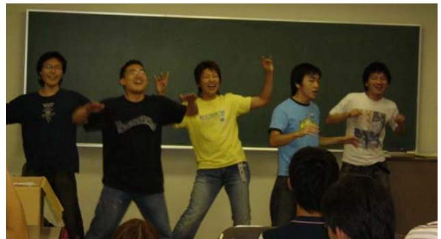
2006年東海・北陸地区でのスナップ

学校や専攻の異なる学生・生徒、さまざまな国や地域からの留学生との交流を通じて相互理解・国際親善の促進につながる活動をします。