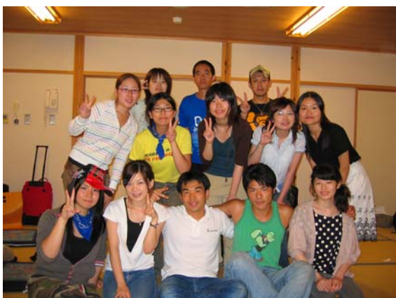
語らいの合間に仲良くポーズ（関東地区）